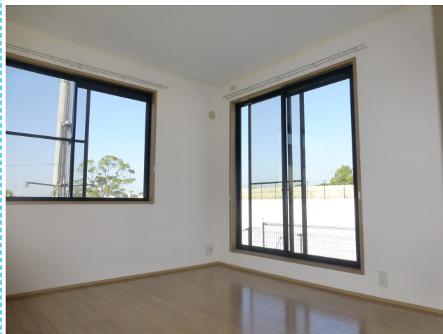
人気の角部屋♪窓が2つあり、風通しも良いです♪