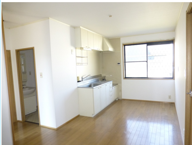
お掃除がしやすいキッチンパネルです♪