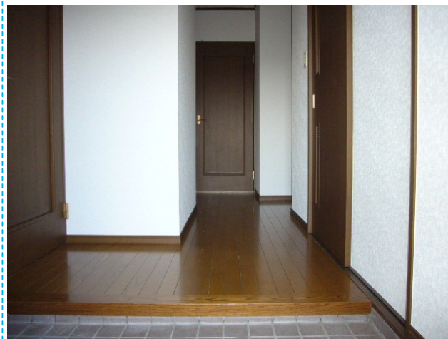
間取りは反転する場合がございます