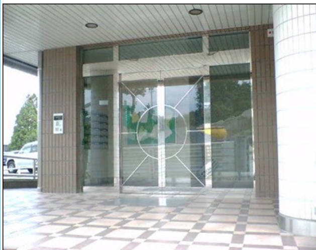
オートロックマンション★