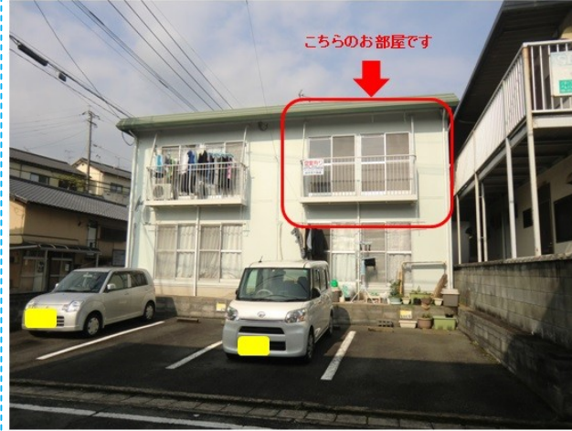
【外観】2階角部屋です