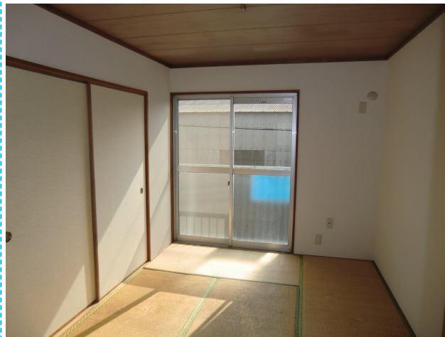
【和室6帖】大きな窓・バルコニーです