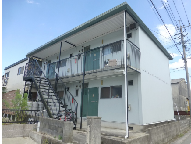
【外観】入口階段です