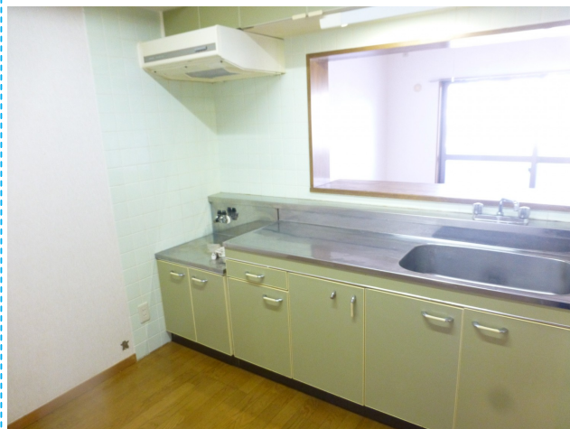
4.5帖の広さで、調理機器などを置くスペースも充分取れます♪