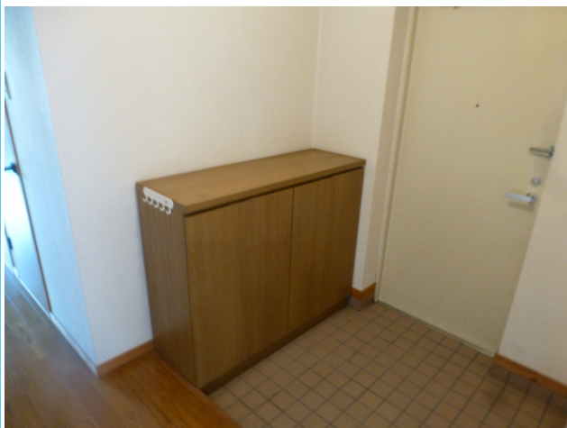
シューズボックス上にグリーンや小物も飾ることができます♪