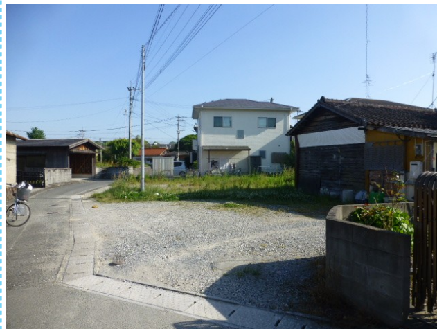
前面道路含む現地写真 北側より撮影