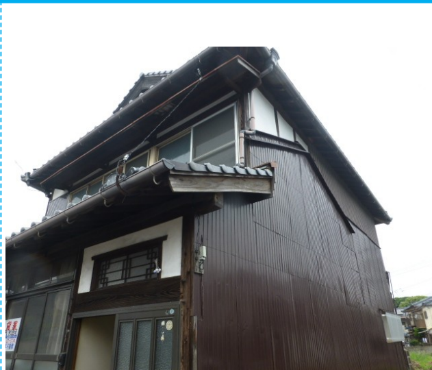
2階建ての広いお家です。