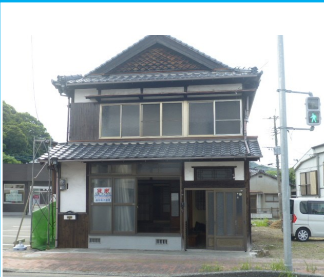
2階建ての広いお家です。