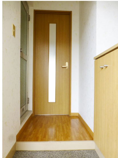
下駄箱付きの玄関