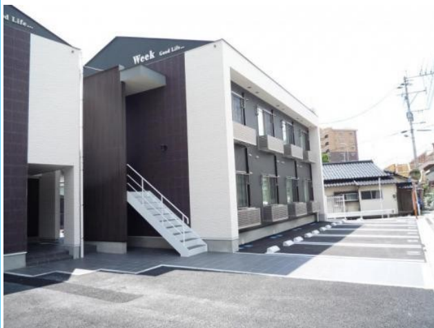
新飯塚駅まで徒歩5分♪