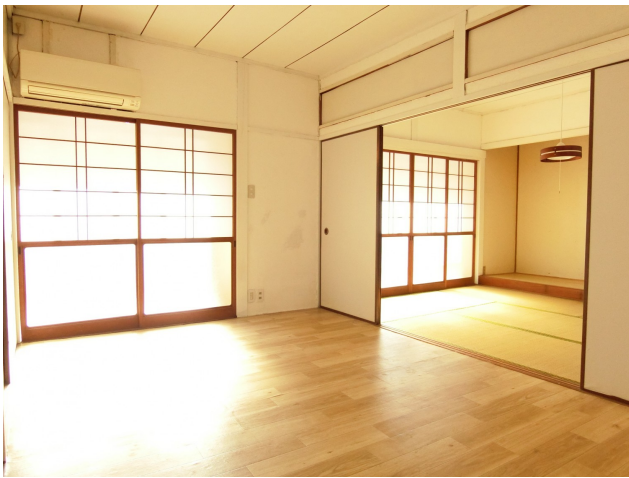
二間続きで広く使うこともできます♪