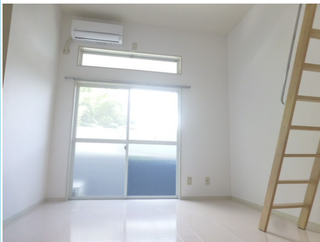
南向きの明るい洋室