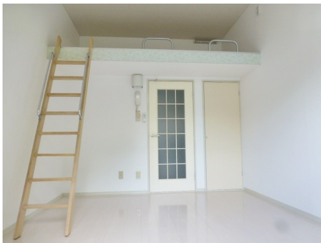
ロフトがあるので天井が高く開放感のある洋室です。