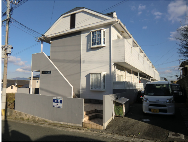
閑静な住宅街にあります