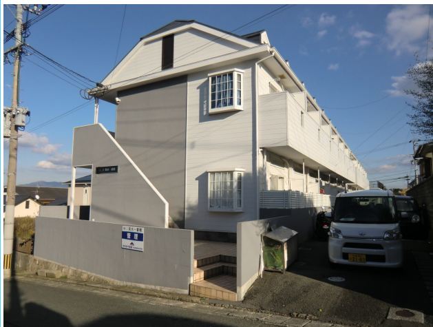
閑静な住宅街にあります