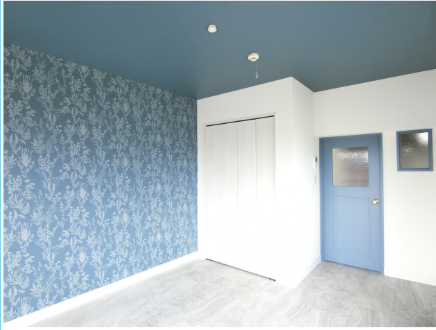
アクセントクロスのおしゃれな洋室