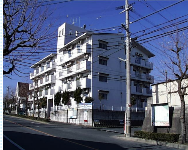
★インターネット無料 (wi-fi)