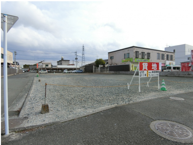
三方道路になります。