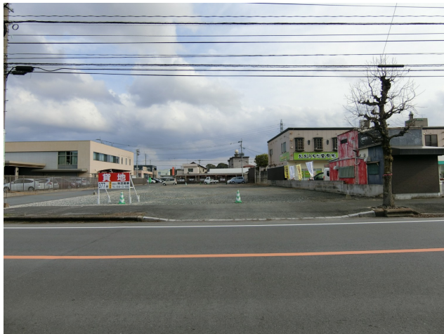
三方道路になります。