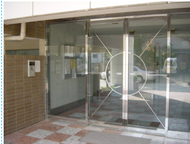
オートロックマンション