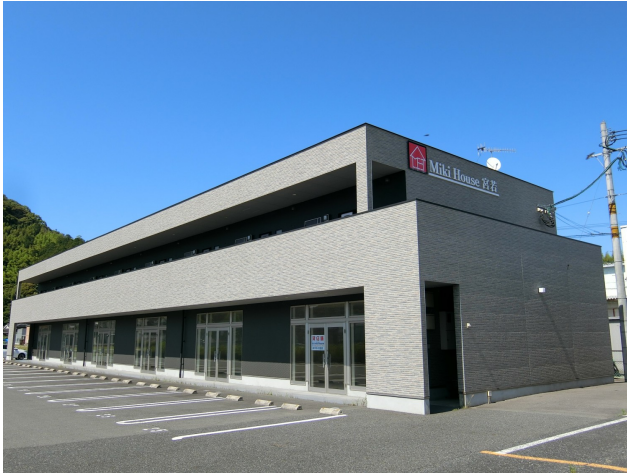
写真は同タイプのお部屋のものです。現状優先