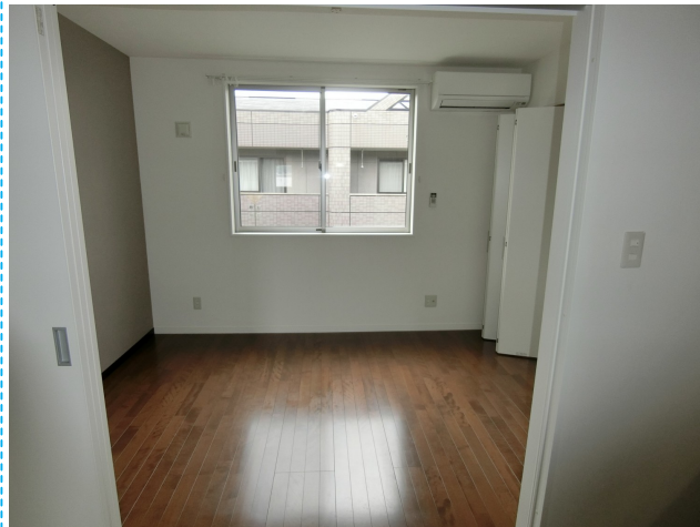
エアコンもあり新生活も快適に過ごせます♪