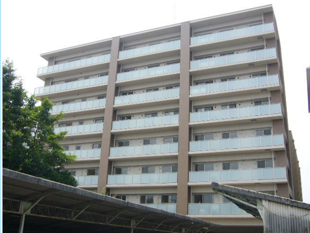
写真は現状を優先します