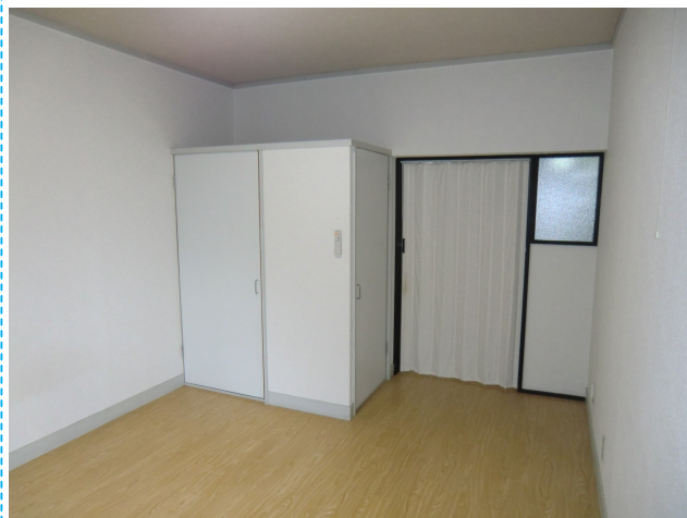
白を基調とした洋室