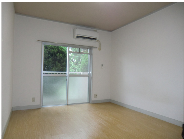
南向きの明るい洋室