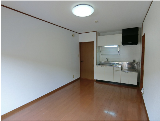
たっぷりと光が差し込む明るいダイニング