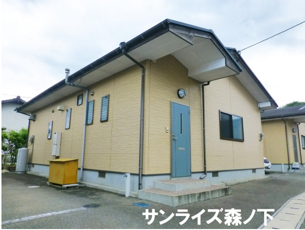
サンライズ森ノ下