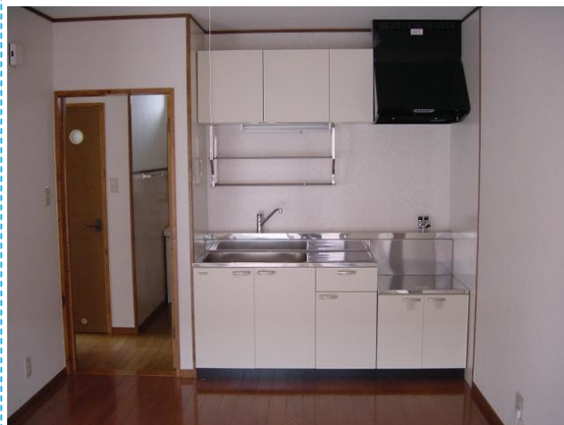
シングルレバータイプの水栓なので温度調節が楽です♪