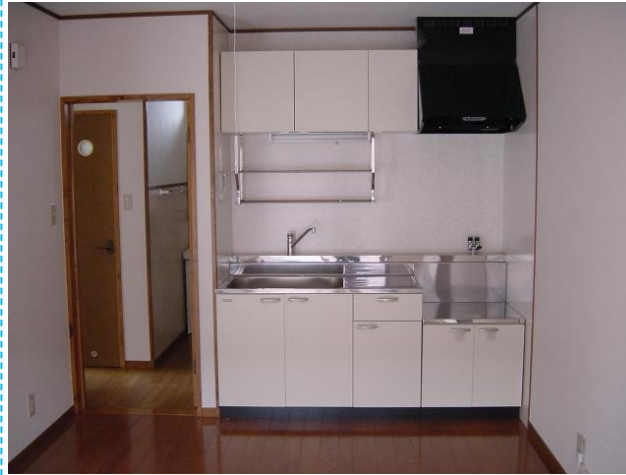
シングルレバータイプの水栓なので温度調節が楽です♪