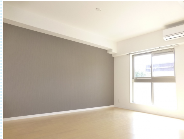
アクセントクロスがモダンなリビング