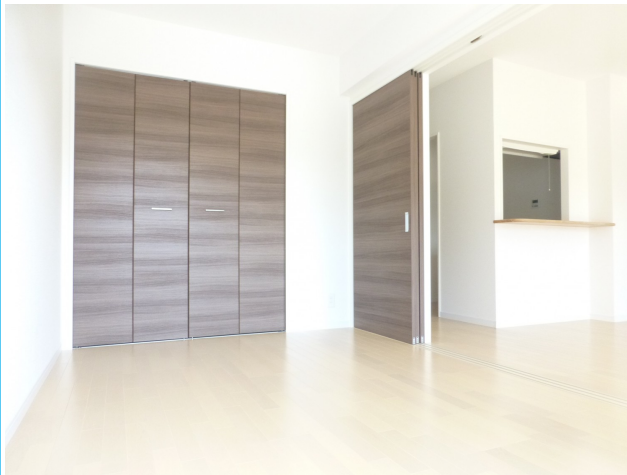
洋間 ～ リビング