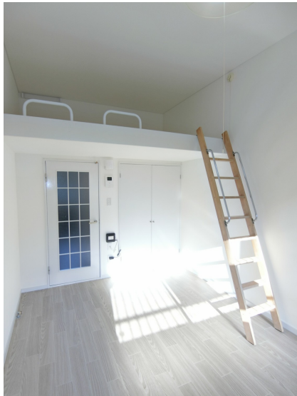
ロフト付きの明るい室内