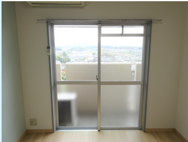
高台にあり空にぬける見晴らしが魅力