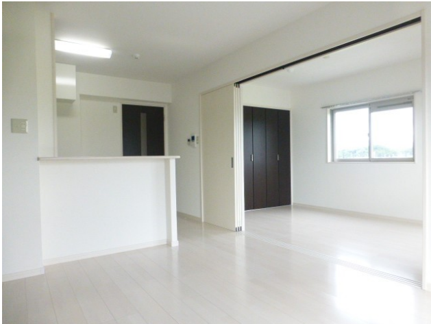
白をベースとした明るい室内