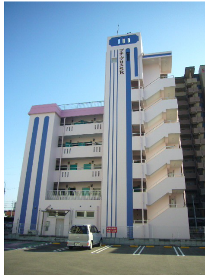
便利な立地にあります♪