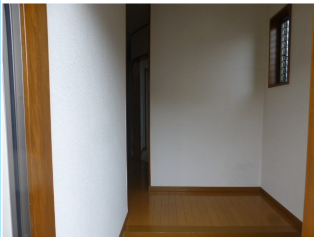
急な来客時でもお部屋の中が見えず安心です