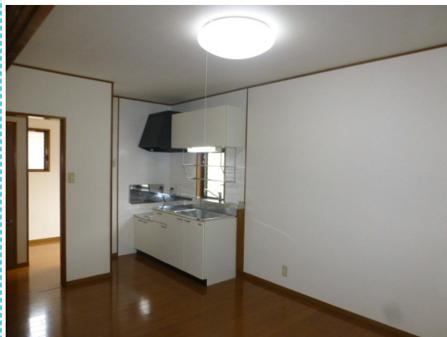
照明も付いているので新生活もすぐにスタートできます♪